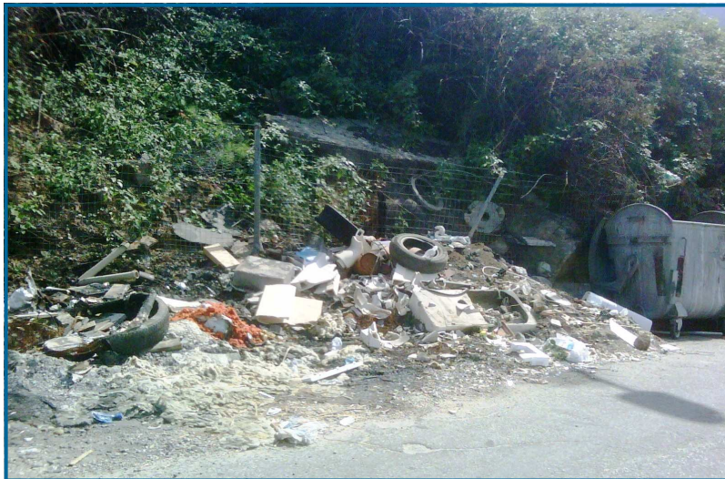
Rifiuti già bruciati nell’unica strada che collega il quartiere Ieracari

Per sopperire a necessarie esigenze però l’Amministrazione attiva ricorre ad altre forme di assunzione di personale e pertanto: assume a tempo determinato con contratto o si rivolge al lavoro interinale impiegando